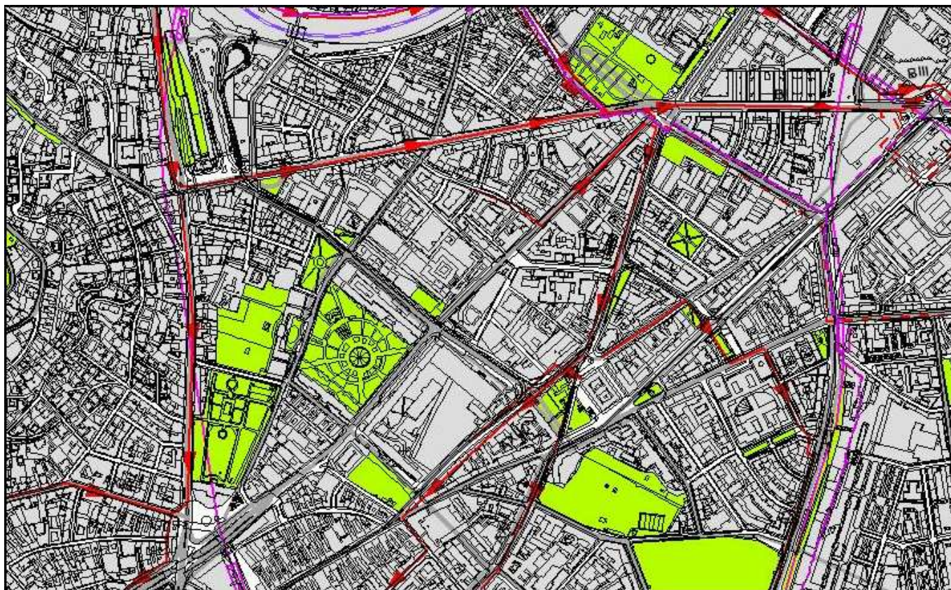
4.2. Odkanalizovanie, vodné plochy a vodné toky - zosúladienie