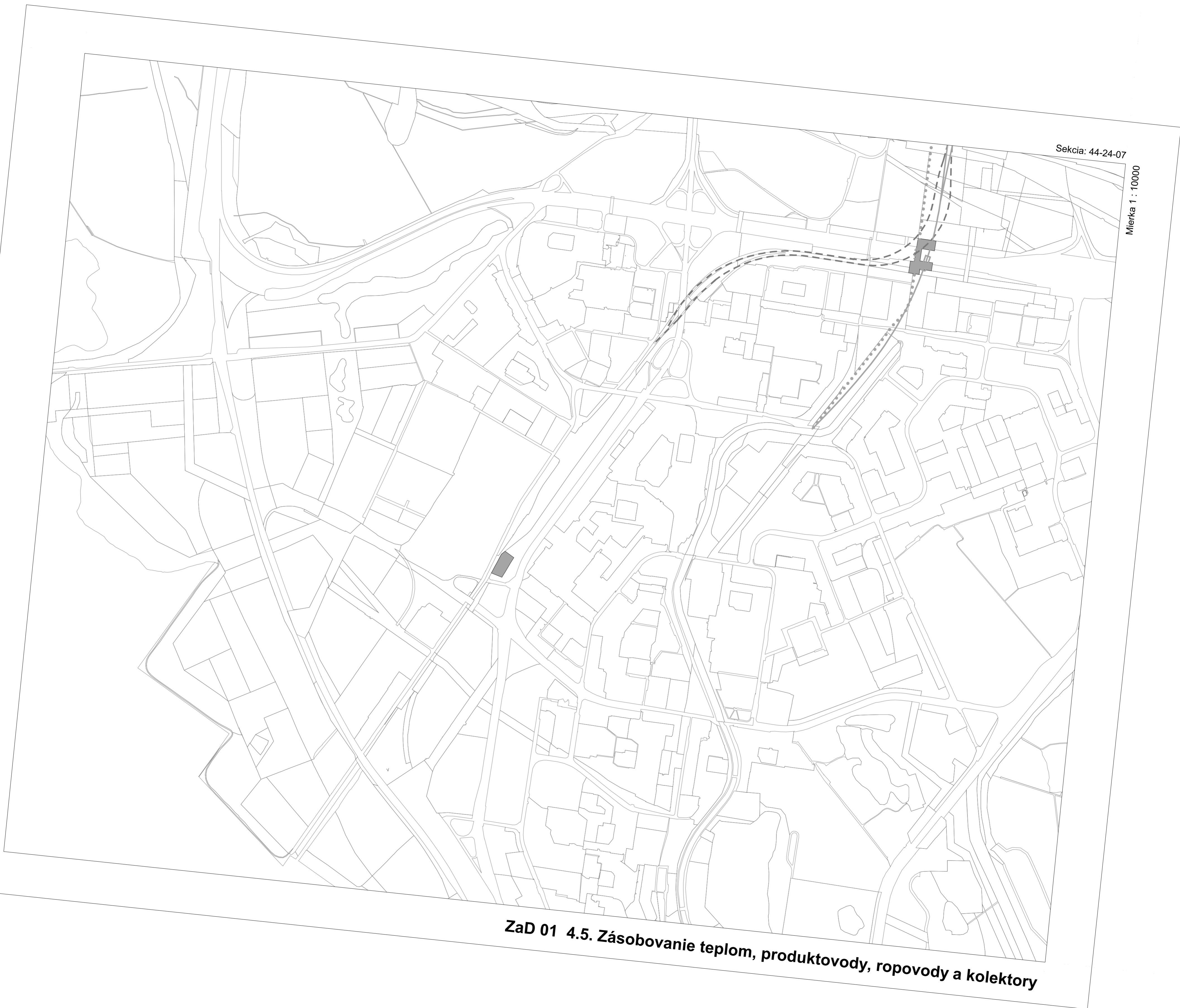
ZaD 01 4.5. Zásobovanie teplom, produktovody, ropovody a kolektory